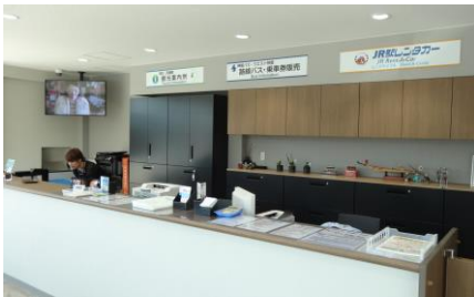
観光案内所・交通事業者窓口